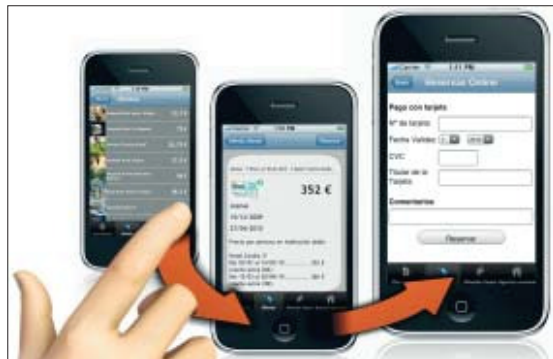
La reserva 'online' se realiza de forma muy sencilla.

De momento sólo se ha realizado para este teléfono "porque es el más dinámico e interactivo y es el único