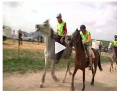
ANDALUCÍA Cuarta etapa del V Raid Kaliber Andalucía con salida en Villamartín y llegada en Ronda (Málaga)