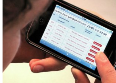
Un turista atrapado en el aeropuerto consulta en el móvil el estado de su vuelo en la reciente crisis del caos aéreo por la erupción del volcán islandés.

El Patronato ultima un sistema de gestión del destino y la Junta pondrá en marcha la Comunidad Virtual