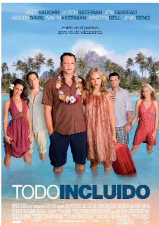
'Todo incluido', promocionada por Kirunna y Tahití Tourisme.

Mayoristas, hoteleras, oficinas de turismo y agencias han encontrado en el cine un medio rentable para promocionar sus marcas y los destinos que ofertan. En los últimos años se han incrementado los acuerdos entre las distribuidoras o productoras cinematográficas con los profesionales del turismo, quienes piensan seguir poniéndolo en práctica tras haber descubierto que en cualquier género de película existe una buena herramienta de marketing.