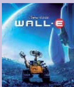
Almeida utilizó 'Wall-E' para promocionar su marca.

Las películas en las que han colaborado las empresas turísticas (turoperadores, cadenas hoteleras, agencias de viajes u oficinas de turismo) para posicionarse como marca o publicitar sus productos turísticos, abarcan todo tipo de géneros.